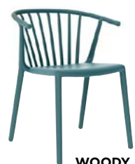
WOODY L 57, P 59, HA 45, H 74 cm

Pour un usage en intérieur et en extérieur. Fabriquées en polypropylène et fibre de verre. Protection UV. De nombreux coloris disponibles.