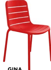
GINA L 52, P 52, HA 46, H 80 cm