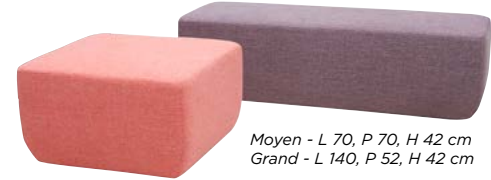
Moyen - L 70, P 70, H 42 cm Grand - L 140, P 52, H 42 cm

CORAL est vraiment une assise multifonctionnelle. Soyez créatif et sachez combiner les couleurs et les matières pour concevoir une atmosphère unique.