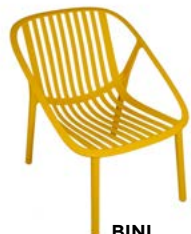
BINI L 60, P 60, HA 45, H 87 cm