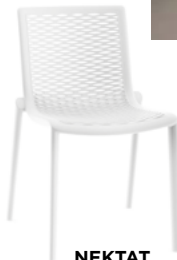
NEKTAT L 56, P 51, HA 47, H 79 cm