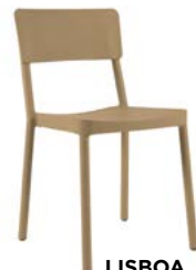
LISBOA L 48, P 52, HA 46, H 82 cm